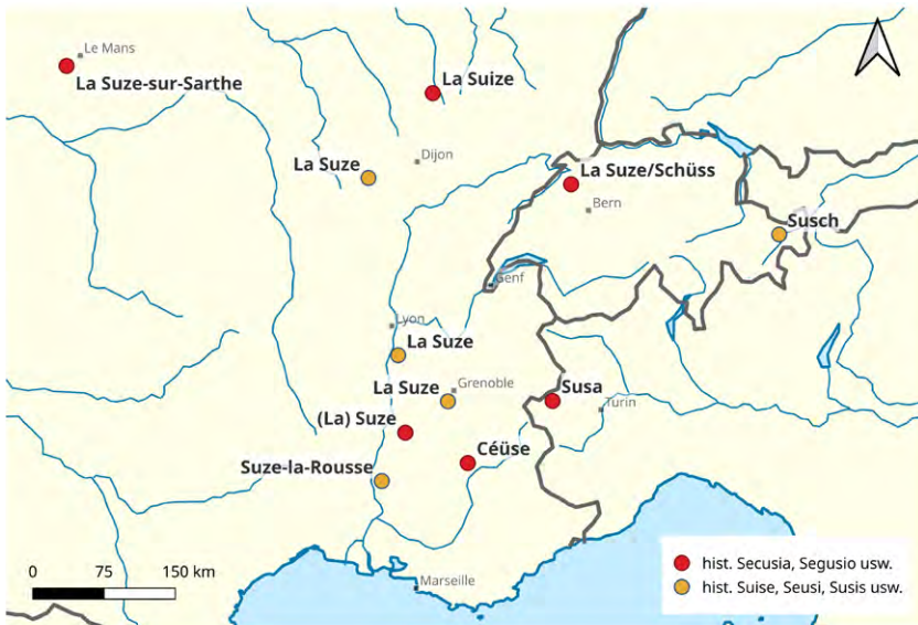
Abbildung 3: Verbreitung der Segusia -Namen.

Mehrere oben besprochene Gewässer- und Siedlungsnamen belegen direkt eine alte, unkontrahierte Namenform Secusia , Segusio usw., die eine vermutlich keltische Nominalbildung *Segusiā repräsentieren dürfte; alle anderen erwähnten Namen lassen sich ebenfalls von dieser Ausgangsform herleiten. Dass sämtliche Namen etymologisch zusammengehören, scheint wahrscheinlich. Am wenigsten sicher ist dies beim SN Susch . Die geografische Verteilung der Namen zeigt die Abbildung 3.