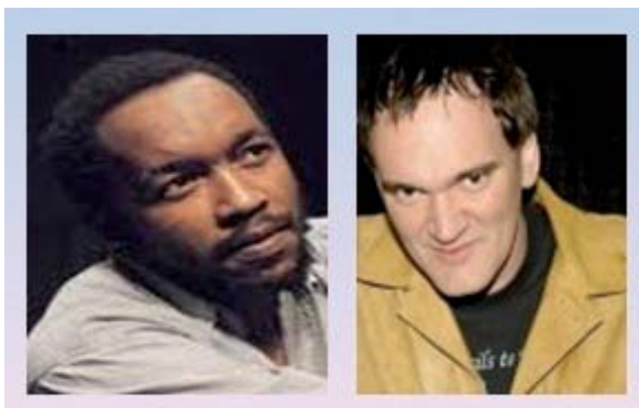
Abb. 1: Paul Grootboom und Quentin Tarantino

Im obigen Beispiel aktiviert der Leser bzw. Hörer den für die Gesamtaussage relevanten Teil des Wissens über Quentin Tarantino. Auf den ersten Blick gibt es jedoch wenige Ähnlichkeiten zwischen Grootboom und Tarantino.